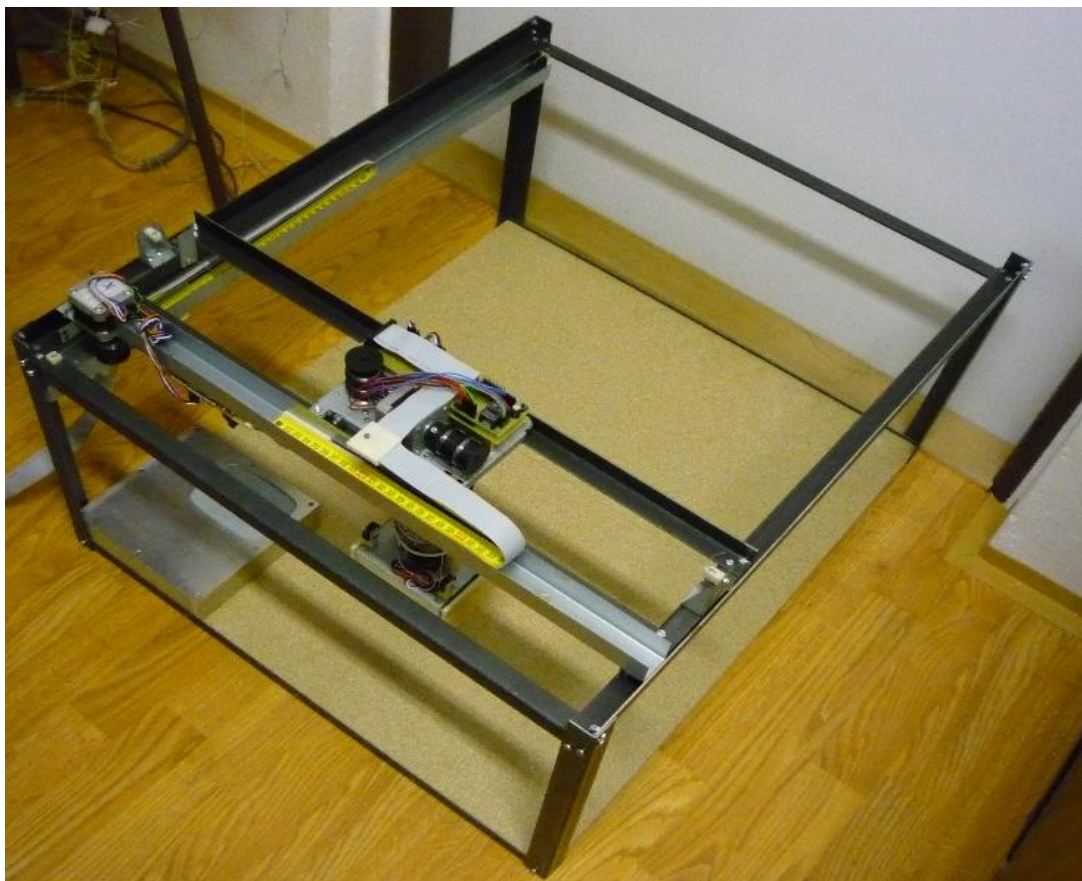
Obr. 1: Model sklada